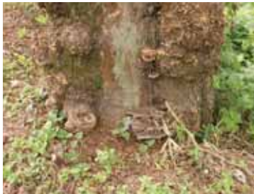
地際がベッコウタケに侵されている。