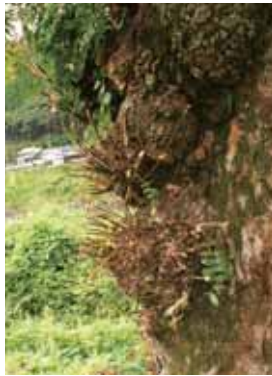
切断された枝幹に癌腫病

山野や河原に生え植栽もされた。さて、今回紹介した神河町のサイカチの現在の状態は満身傷だらけである。