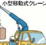
小型移動式クレーン