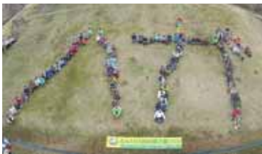
波賀町での植樹ボランティア

株主は0歳から九十歳、住所は北海道から九州まで幅広い方が参加されており、平成二十八年度会員は七百名になっております。