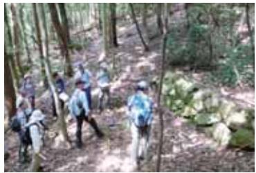
明治期に実施された石積み

探索ツアーは再度公園周辺において、明治の石積みや昭和の治山ダムなど、先人が技術と努力により築きあげた防災施設や、それらによりよみがえった六甲山の緑を森林インストラクターの案内で巡りました。