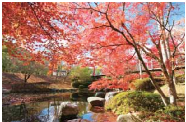
里山林整備体験会場(多可町余暇村公園)

会場には駐車場はございません。各臨時駐車場から無料シャトルバスをご利用ください。詳細は公式サイトにてご確認ください。多可町HP http://www.takacho.jp/mor/inomatsuri2017/index.html