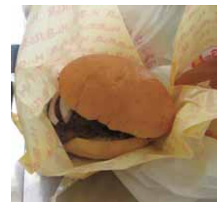
鹿肉バーガーの試食

鳥獣害対策について知ってもらうため、森林動物研究センターによる森林動物の剥製と解説パネルの展示（5日のみ）、鹿肉バーガーの試食体験を実施しました。鹿肉をミンチやスライスにして柔らかくする工夫がされており、参加者からも「想像していたよりおいしい」と好評でした。