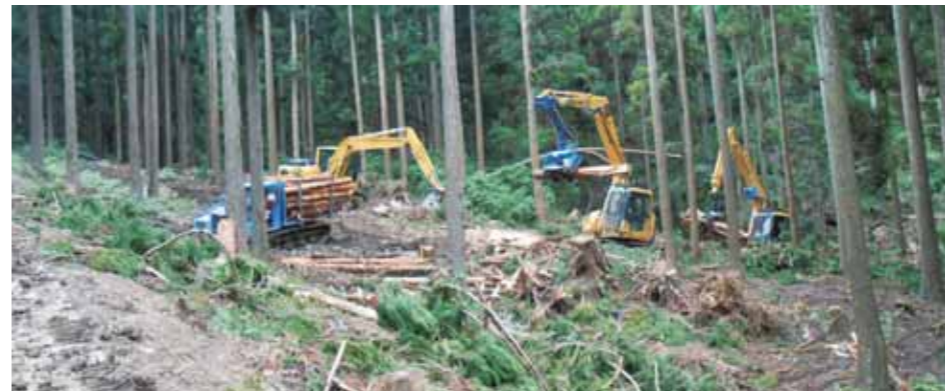
写真1 利用間伐実施状況

主伐期を迎えたヒノキ林については、木材価格の上昇が見られず厳しい状況が続いており、主伐の実施を見合わせている一方で、スギ林を中心に、経済性・公益性に配慮した利用間伐事業を積極的に進めております。また、将来の主伐事業実施に向け、作業道の開設と利用間伐を組み合わせ、作業の効率化や高性能林業機械による搬出コストの削減、山土場での直接販売による運搬経費の削減等による収益性の確保と利用間伐の拡大に努めております。