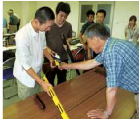
マイスター育成スクール

ている中で将来的に必要となる、市町の垣根を越えた捕獲体制の構築を見据えています。