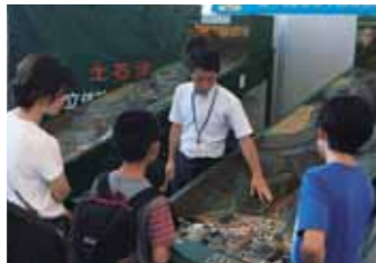
土石流実験装置による実演

三 六甲山の緑の原点探索ツアー 江戸から明治にかけての六甲山は、雪が降り積もったかのような真っ白なはげ山で、毎年、大雨ごとに土砂災害が発生していました。このため、明治36年から大正4年にかけて再度山一帯では、石積みや植林工事が実施されるようになりました。