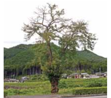
枯れ枝が多く発生・落下の危険も目立つ。

このままだと、将来長く生きられないかもしれない。早急な環境改善等の措置が必要と思われる。このサイカチから種子を取り後継樹を育て樹と人々の共存の場として後世に残したいものである。今回、ここに紹介した様な樹木をはじめとする兵庫県の緑の文化遺産がこれまで果たしてきた役割や価値観が時代と共に変化してきている。今こそ、これらを発掘し、将来に向けて継承する努力を惜しまない体制が必要ではないだろうか。我々は昔々の話しを発見し、新たな芽を出す様な仕掛けが必要だと思ふ今日この頃だ。