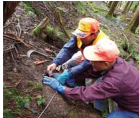
くくり罾の技術講習会