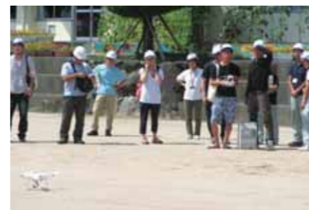
ドローンの操作体験

川上から川下への林業全体の理解促進のため、大学校生によるチームソー実演、参加者によるドローンの操作体験、大型製材工場の見学を行い、ドローンを使った新しい森林調査の手法など先進的な林業や、木材がどのように製造されているかを体験してもらいました。