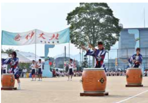
中町中学校生徒による竜神太鼓の演奏

秋の澄んだ高い空のもと、県警音楽隊による演奏が会場の多可町中央公園の周辺にこだましてひょうご森のまつり2017のオープニングです。式典では、主催者のあいさつやご来賓の方々のご祝辞のあと、永年、森づくりに貢献された方々等の表彰式や森林ボランティア活動報告、緑の少年団の宣