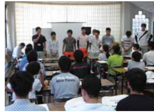
在校生（1期生）の体験談

県では、森林林業の即戦力となる人材、次代のリーダーとなる人材、森林を通じて地域に貢献する人材の育成を目指して、森林林業に関する専門知識などを学ぶ2年制の専修学校として、平成29年4月、兵庫県六栗市に兵庫県立森林大学校を開校しました。 このたび、森林大学校2期生の募集に際し、学校のPRを広く行うため、オープンキャンパスを8月5日(土)と8月26日(土)の2回来年度から校舎となる六栗市立染河内小学校等で開催しました。