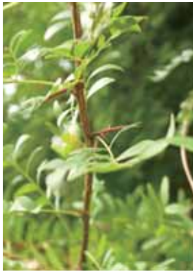
当年枝から出ている棘

日本固有種・本州・四国・九州に自生し、樹高が20m直径が1mになる。幹に枝の変化した棘がある。