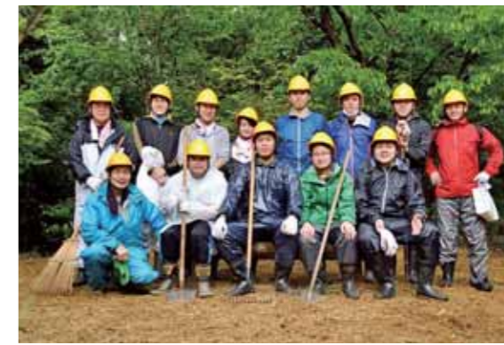
企業の森づくり活動参加メンバー

同社の「環境ビジョン2021」の一環として、兵庫県立やしろの森公園において企業の森づくり活動を開始しました。森林整備活動等を通じて森林の公益的機能の維持増進に配慮するだけでなく、社員自らが汗をかき、地球環境を保全する取組みを行っています。