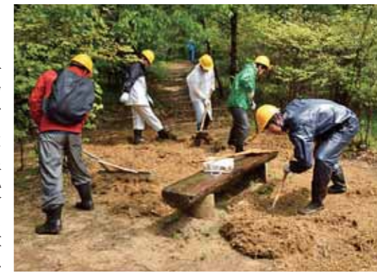
遊歩道の整備作業

この活動では、普段の生活では接する機会が少ない森林や動植物を肌で感じ、触れ合える森林をめざし、活動参加社員や公園利用者が親しめる「森づくり」を行っています。(公社)兵庫県緑化推進協会