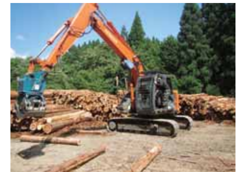
グラップルの操作体験

林業現場での仕事について理解を深めてもらうため、地元の林業事業体による立木伐採の実演と、参加者による高性能林業機械（プロセッサ、グラップル、フォワード）の操作体験を行いました。