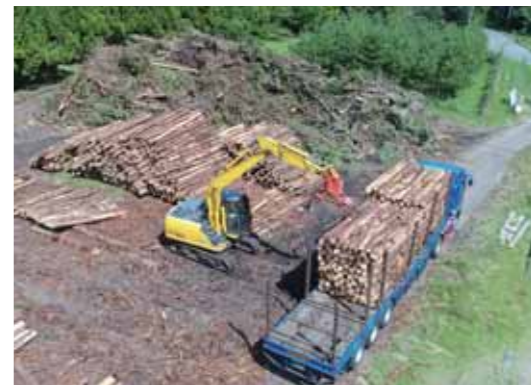
写真2 山土場での搬出状況

朝来市山東町野間において、約4haを実施しており、素材生産による収穫や跡地造林等、近年数少ない作業を実施し伐出コストの削減や獣害対策等の課題と検討に取り組んでおります。