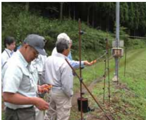
集落ぐるみ被害対策モデル実証

集落で鳥獣害対策の核となる人材の育成を目的に、⑤「集落ぐるみ被害対策モデル実証(H21～24)」等を行いました。同対策を行ったある集落では、県内外からの視察が来ていると聞きます。