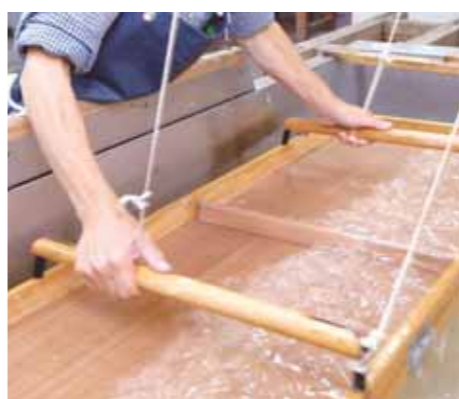
日本一の手すき和紙「杉原紙」

広大な山林と清らかな川の流れば、千三百年の歴史があるとされる和紙「杉原紙」や日本一の酒米「山田錦」の発祥の地とされる米