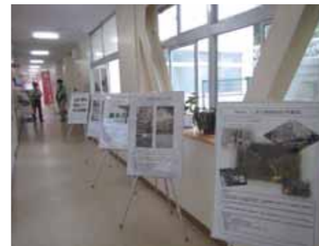
林業事業体のパネル展示

学校説明会には、県内外から延べ41名の参加があり、大学校のカリキュラムや入学試験、通学・住居等の生活環境についての説明、在校生による体験談のほか、校舎見学、林業事業体のパネル展示による紹介を行いました。