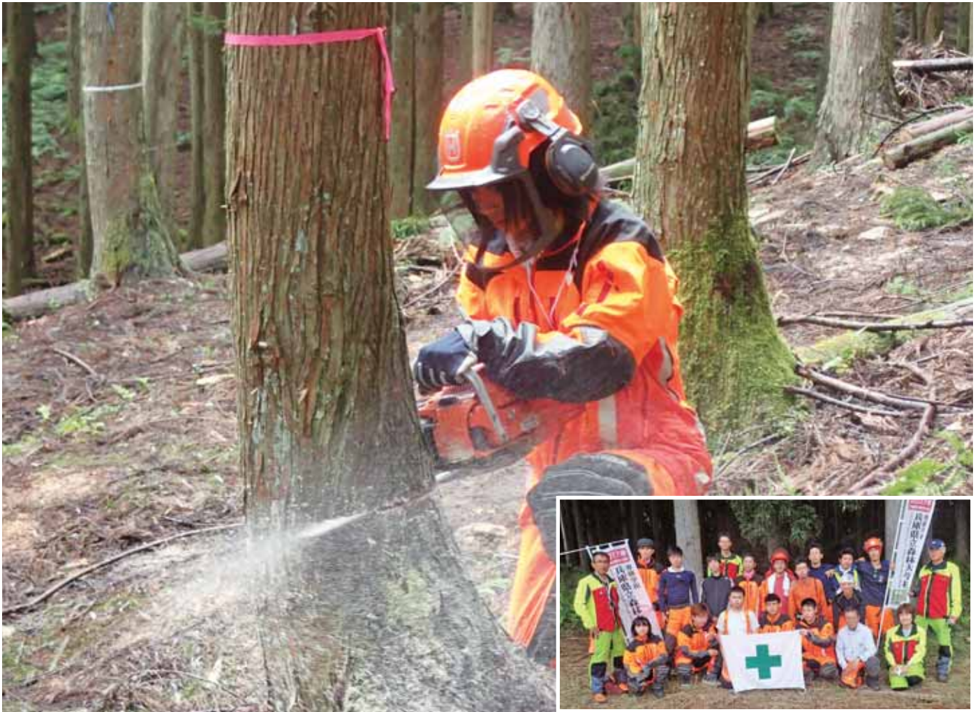
「県立森林大学校の実習の様子」