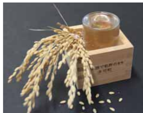
日本一の酒造好適米「山田錦」 日本酒で乾杯の町 多可

十分にお楽しみ頂けます。それでは会場の皆様のご来場をお待ちしています。