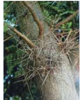
幹から棘が出る。茎・枝の変形で茎針と呼ぶ。

雌雄同株で、豆果は薬用になり、サヤをすりつぶして石鹼(サポニン含有)の代用に、また新葉は食用になっていた。