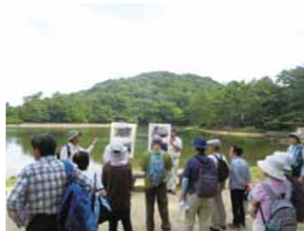
緑がよみがえった再度山

今後も、県民の皆さま一人一人が理解し行動できるように、減災活動に取り組んでいきたいと思っております。