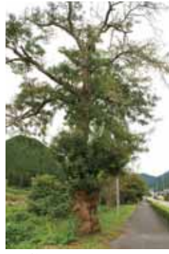
県道8号山田區御旅所のサイカチ

県道8号で神河町山田區御旅所の歩道と越知川の間に一本の大きな木がある。これぞ、この地に残るサイカチである。