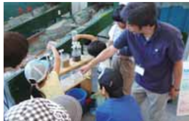
土壌の保水力実験

また、会場では「土石流実験装置」、「3D立体映像装置びっくりくん」、「地すべり模型実験装置」等による実演に加え、森林・はげ山・岩山の3種類の土壌について保水力の違いをペットボトルを使って比べることができ、実験も行いました。