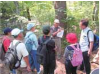
森林インストラクターによる案内